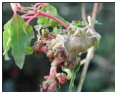
Sådan kan et galmideangreb se ud.

Galmiden, som sidste år var i 10 haver i Bretagne, har nu - selv om alt i de 10 haver blev brændt - bredt sig til 110 haver langs den sydlige kyst af Bretagne helt til Nantes. Der er fra de franske myndigheder sat stor fokus på problemet, og 3 inspektører kører til stadighed i området og kontrollerer. Alt i de 110 haver skal brændes, og det straffes nu med 200.000 EUR i bøde eller ubetinget fængsel, hvis man ikke følger de anvisninger, der gives fra myndighedernes side.